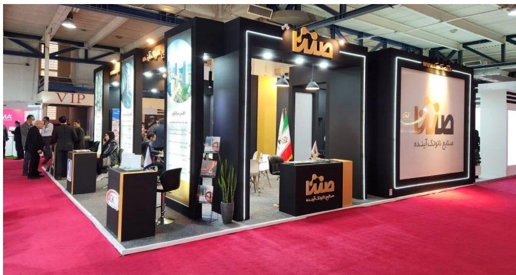
شکل ۳: پايون ساخته شده هلدينگ صنایع نانوتک

هلدينگ صنایع نانوتک مفتخر است که در چهاردهمین نمایشگاه فناوری نانو بصورت حداکثري حضور یافته و به عنوان بزرگترین پايون نهاد سرمایه‌گذاري در نمایشگاه به فناوران و بازدیدکنندگان محترم ارائه خدمات کند. باتوجه به مترائ ۱۰۰ متری پايون شرکت و همچنین قرارگیری پايون بصورت ۳ ضلع آزاد طرح نهایی جهت پیاده سازی بصورت ذیل نهایی گردید. شکل ۳ پايون ساخته شده هلدينگ در نمایشگاه بین‌المللی نانو در محل دائمی نمایشگاه‌های بین‌المللی تهران (سالن خليج فارس) می‌باشد.