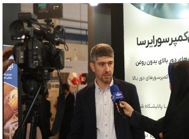
شکل ۶: پوشش زنده و گسترده شبکه‌های خبری با مدیرعامل محترم صننا و شرکت‌های تابعه