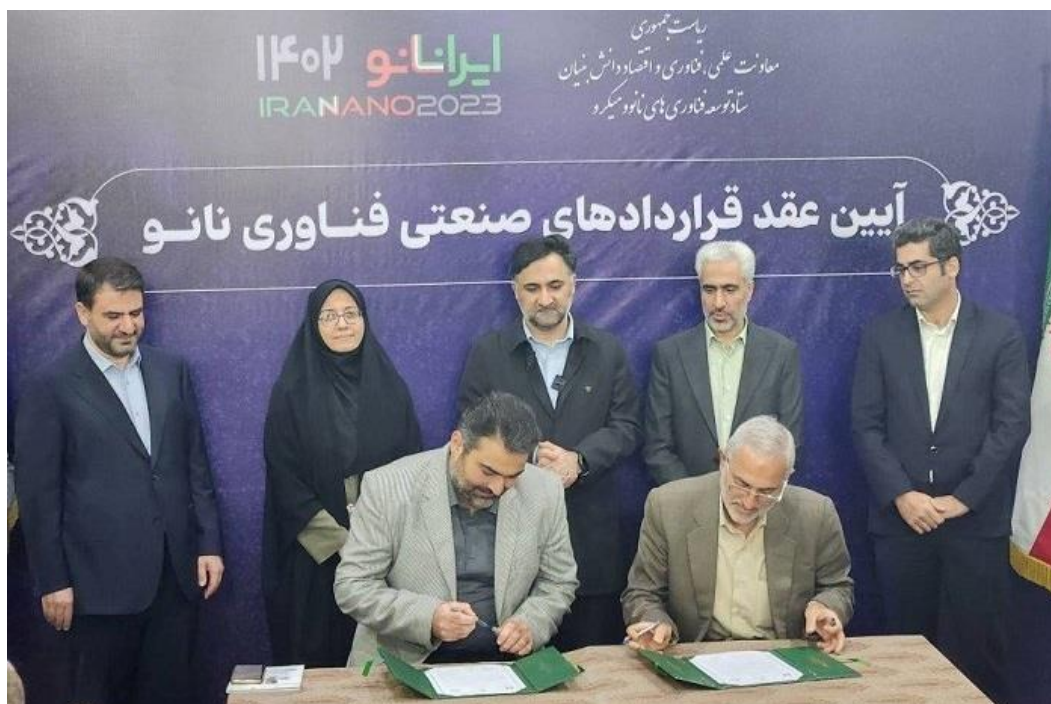
شکل ۷: مراسم عقد قرارداد فروش

۱. امضای قرارداد فروش رنگ پوشان شرکت نانو تک فام گیتی و شرکت ریخته گری ایران خودرو در حضور معاون محترم علم و فناوری ریاست جمهوری و ستاد نانو / تامین یکساله نیاز ریختهگری ایران خودرو