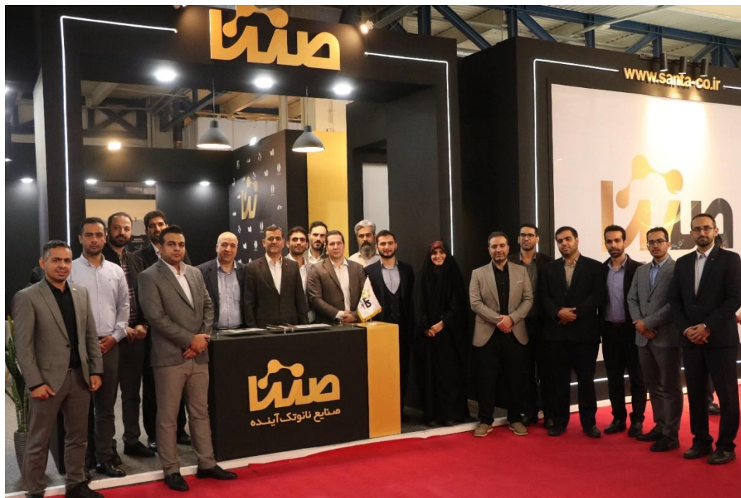
شکل ۱۱: عکس یادگاری پرسنل سنتا در چهاردهمین نمایشگاه فناوری نانو

در انتها این هلدینگ ضمن تشکر از مدیران ارشد ستاد اجرایی و ستاد توسعه فناوری نانو، امیدوار است تا با تلاش مستمر خود در تامین مالی فناوری‌های برتر و کمک در پیشبرد فعالیت شرکت‌های تابعه، نقش موثری در تحقق اقتصاد دانش‌بنیان کشور ایفا نماید.