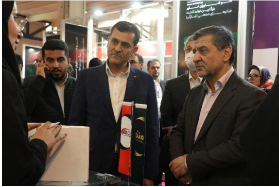
▪ بازدید جناب آقای دکتر باقری فرد، معاون محترم وزیر بهداشت