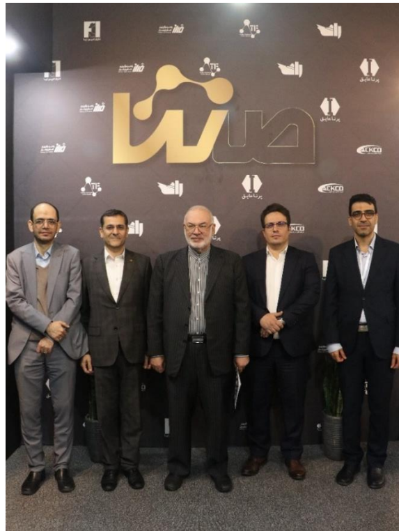
شکل ۹: برگزاری جلسه هیات مدیره شرکت

۳. برگزاری جلسه هیات مدیره شرکت با حضور تمامی اعضا در پایون سننا