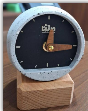
شکل ۴: کاتالوگ‌ها و هدیه تبلیغاتی صنتا در نمایشگاه