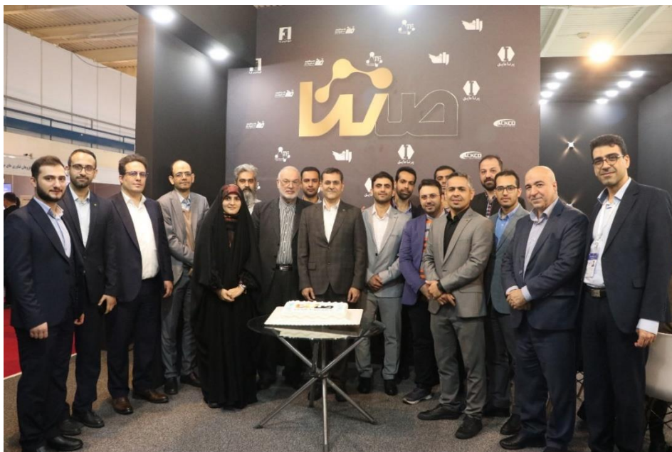
شکل ۱۰: جشن صدمین جلسه هیئت مدیره هلدینگ سننا

۴. عکس یادگاری صدمین جلسه هیئت مدیره هلدینگ همراه با تمامی اعضاء شرکت