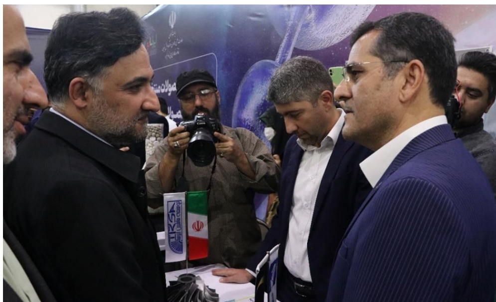
شکل ۸: رونمایی از محصول فناوران کمپرسور ایرسا

۲. رونمایی از جدیدترین محصول شرکت فناوران کمپرسور ایرسا / کمپرسور گاز دور بالا