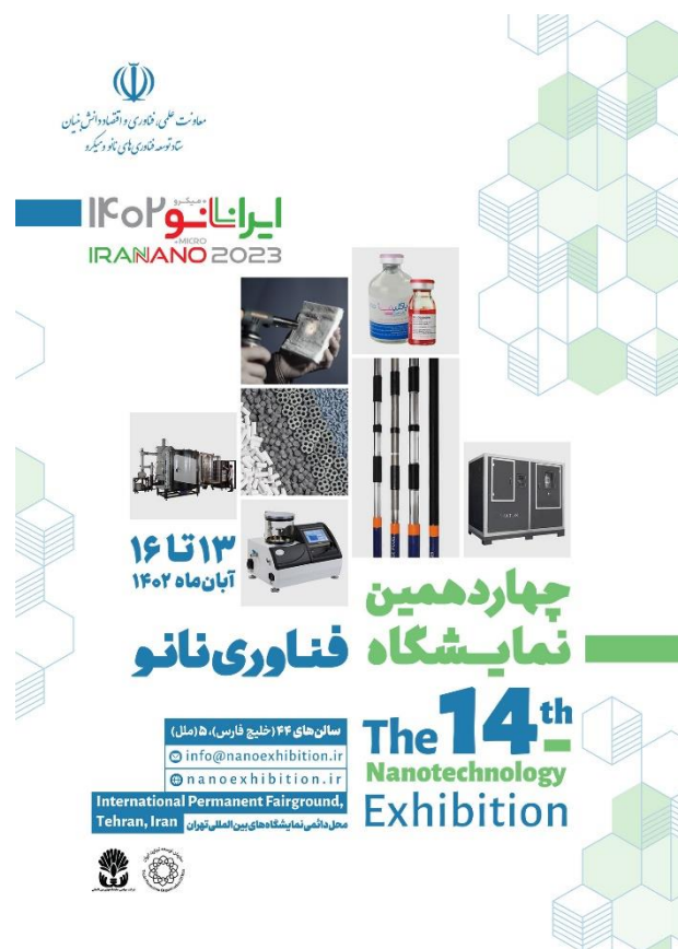
شکل ۱: پوستر چهاردهمین نمایشگاه فناوری نانو

چهاردهمین نمایشگاه بین‌المللی فناوری نانو ایران در تاریخ ۱۳ الی ۱۶ آبان ماه سال ۱۴۰۲ در محل دائمی نمایشگاه‌های بین‌المللی تهران برگزار گردید. این نمایشگاه با حضور بیش از ۹۰ شرکت فعال نانویی در سالن‌های ملل و خلیج فارس و همزمان با بیست و سومین نمایشگاه بین‌المللی صنعت کشور برگزار گردید. مشارکت کنندگان در این نمایشگاه را شرکت‌های تولیدی فعال در بخش‌هایی نظیر سازندگان تجهیزات، خودرو، آب و محیط زیست، بهداشت و سلامت، ساختمان، کشاورزی و بسته‌بندی، نانومواد، نساجی، نفت و صنایع وابسته و همچنین شرکت‌های فعال در تجاری سازی محصولات نانویی نظیر شرکت‌های سرمایه گذاری خطرپذیر، صندوق‌های سرمایه گذاری و غیره تشکیل دادند. هم زمانی برگزاری این نمایشگاه با نمایشگاه بزرگ صنعت کشور، سبب بازدید بخش زیادی از بازدیدکنندگان و مخاطبین از نمایشگاه فناوری نانو و برگزاری هر چه پرشورتر این رویداد ملی فناوری کشور گردید.