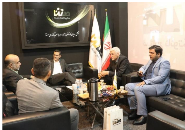
▪ بازدید هیئت مدیره محترم صندوق پژوهش و فناوری توسعه فناوری نانو